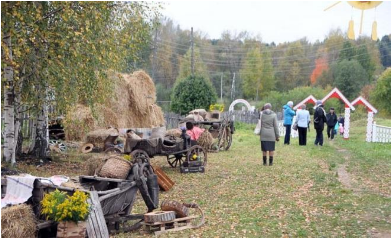
деревня Сеп Игринский район, Удмуртская Республика, Россия 57.524402, 53.313350